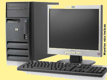
Solução Folha Online