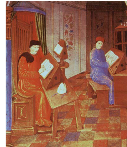
O monge copista

Quais as falhas deste processo comunicacional?