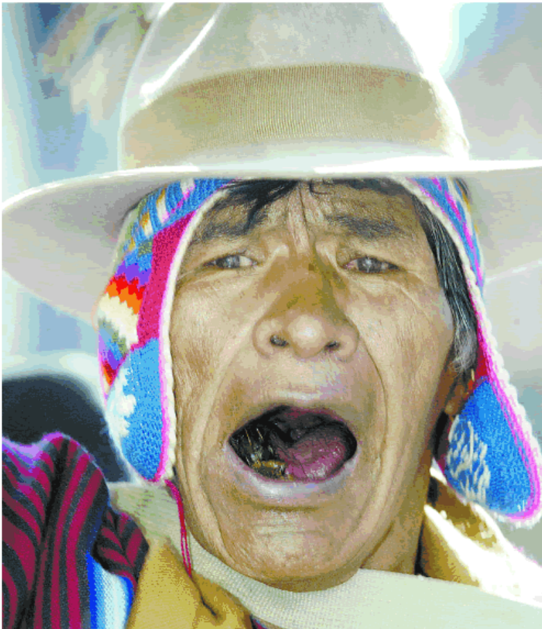
Indígenas, agricultores e mineiros bolivianos realizam passeata por La Paz e pedem novas eleições e fim a uma crise política

Em SC, povo nas ruas contra preço do ônibus